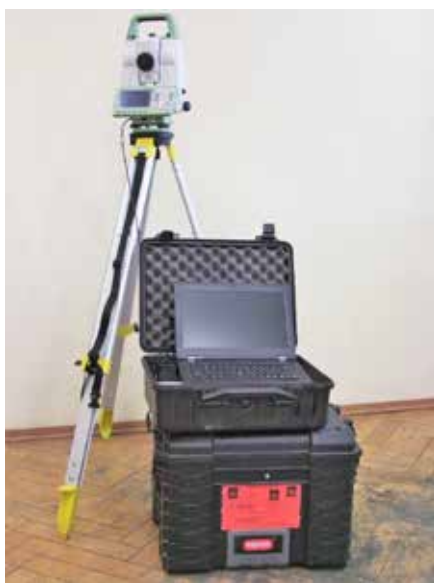
Rycina 2. Przykładowy system do badania statyki konstrukcji, oparty na teodolicie oraz oprogramowaniu geodezyjnym

Such monitoring may take the form of observation without equipment, observation with optical and land surveying equipment (such as a theodolite) or the use of advanced measurement equipment. Building safety officers are appointed as members