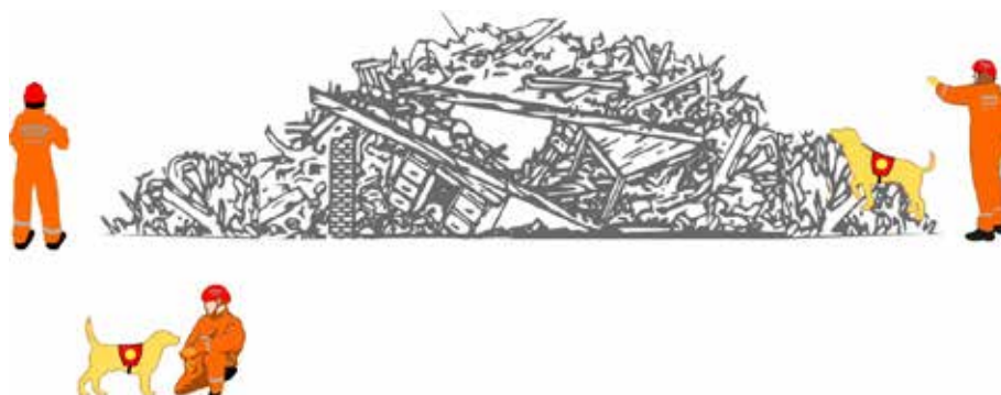
Rycina 4. Przykład organizacji pracy na gruzowisku

The officer is an independent observer who is not directly involved in rescue operations. In the first phase of any operation, when human resources are limited, the function of the operational safety officer is assumed by the Commander of Rescue Operations or the Commander of the Section. The function of the operational safety officer is frequently combined with the role of building safety officer. For extensive operations, more than one operational safety officer is appointed (one for each section). It should be emphasised, however, that safety signals issued by any of the rescuers apply to all operation participants present in the immediate danger zone.