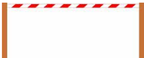
Strefa działań operacyjnych ograniczonego dostępu dla osób postronnych / Operational zone with limited bystander access

In line with the currently valid rules of organising search and rescue operations within KSRG of 2016, the zones should be marked with a white and red tape. The marking should be made using one of two methods, depending on the type of the zone (Fig. 1).