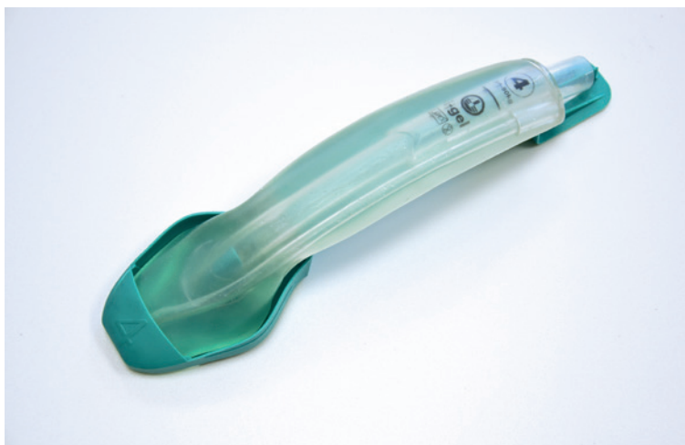
Rycina 5. I-GEL