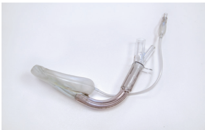
Rycina 4. Maska krtaniowa (Supreme)

W 1988 roku wprowadzono pewną modyfikację maski klasycznej, projektując nowy układ uszczelniający (maska ProSeal). Mankiet w części przodującej jest cieńszy i wyprowadza port umożliwiający odessanie treści żołądkowej. Część tylna została rozbudowana w stosunku do pierwowzoru. Taka budowa znacznie zwiększyła stabilność i szczelność maski, dając komfort pracy nawet przy obciążeniu ciśnieniem 35 cm H 2 O. Dodatkowym elementem jest wbudowane zabezpieczenie przed przygryzieniem. Za wadę należy uznać konieczność użycia dedykowanej prowadnicy w celu prawidłowego założenia maski. Podobnym urządzeniem jest maska Supreme.