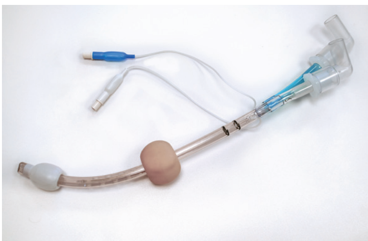
Rycina 6. Rurka Combitube

Rurki tego typu zostają powoli wypierane z wyposażenia ZRM i SOR. Ich wysoka cena, czasochłonna procedura założenia oraz bardzo sztywna część przodująca niejednokrotnie powodująca uszkodzenia błon śluzowych sprawiają, że potencjalni klienci szukają metod bardziej efektywnych. Jest to sprzęt, który wszedł na polski rynek ratowniczy w latach 90. Dziś dostępne są lepsze, bezpieczniejsze i szybsze sposoby na poprawę drożności dróg oddechowych.