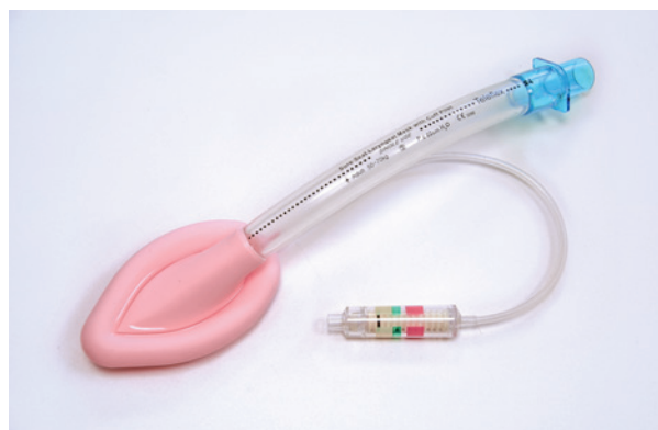
Rycina 3. Maska krtaniowa

Twórcą masek krtaniowych był Archibald Brain. Zamysłem stworzenia tego urządzenia było połączenie maski twarzowej z intubacją. Stosowanie masek pierwotnie miało być ograniczone do anestezjologii. Okazało się jednak, że przyrządy te mogą być stosowane z powodzeniem na etapie przedszpitalnym.