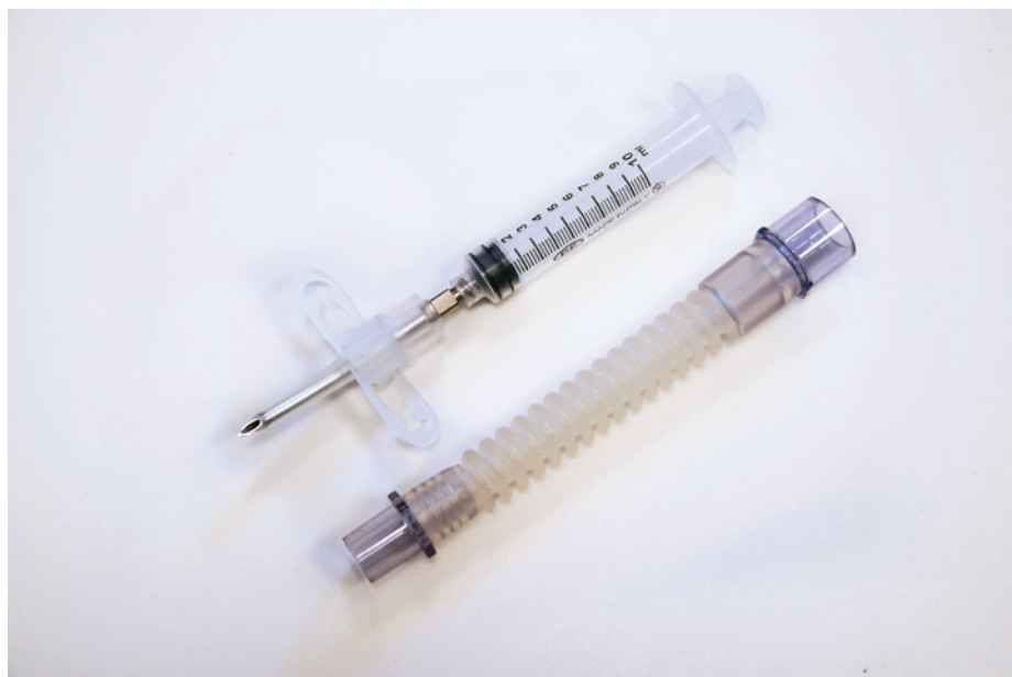
Rycina 9. Zestaw do konikopunkcji QUICKTRACH

Konikopunkcja to technika chirurgiczna udroźniania dróg oddechowych wykonywana w przypadku braku możliwości wprowadzenia u pacjenta rurki intubacyjnej lub zastosowania metod nadkrtaniowych. Polega ona na wprowadzeniu przez błonę pierścienno-tarczową w światło dróg oddechowych gotowego zestawu bądź możliwie grubej igły lub wenflonu (np. pomarańczowego o rozmiarze 14G).