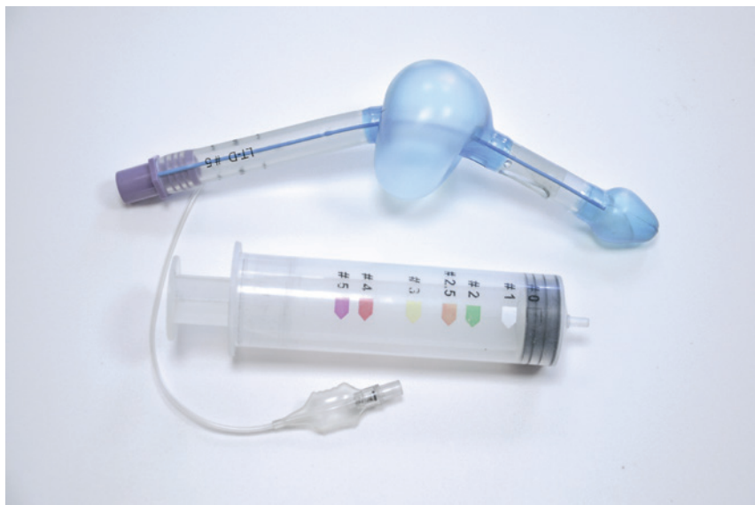
Rycina 7. Rurka krtaniowa (LT)

Rurkę krtaniową można uznać za następcę rurki Combitube. Ideę wentylacji za pomocą przestrzeni pomiędzy dwoma mankietai uszczelniającymi znajdujemy po raz pierwszy właśnie w tym urządzeniu.