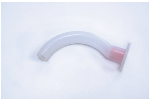
Rycina 1. Rurka ustno-gardłowa

Jednym z elementów pierwotnie blokujących drogi oddechowe może być opadający na tylną ścianę gardła język. W opisie wszelkich technik przyrządowych udrażniania górnych dróg oddechowych znajdujemy zapisy, iż każda interwencja tego typu powinna być poprzedzona manewrami bezprzyrządowymi, takimi jak rękoczyn czoło-żuchwa czy wysunięcie żuchwy. Pierwszym i najprostszym urządzeniem utrzymującym drożność dróg oddechowych jest, opracowana w latach 30. ubiegłego wieku przez Artura Guedela, rurka ustno-gardłowa.